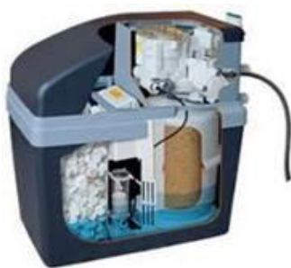
Ontharder met zoutvat

Patronen zijn na een bepaalde tijd uitgewerkt (navragen bij leverancier) en zullen dan verwisseld moeten worden. Zout uit het zoutvat is op een gegeven moment op; het zout zal dan aangevuld moeten worden.