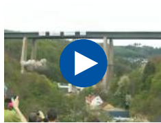
Duits brug ge...