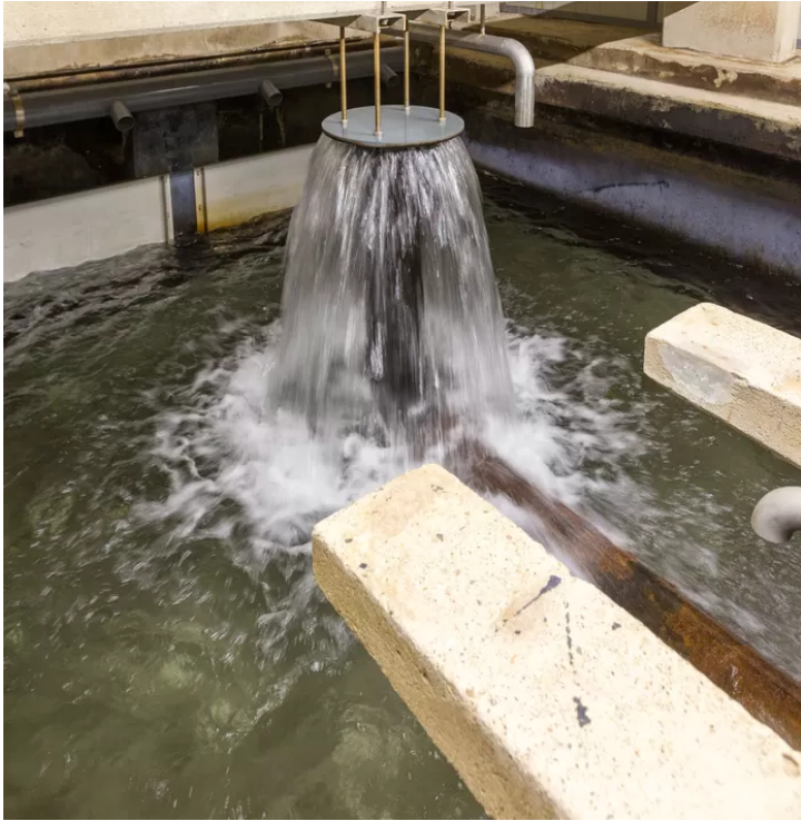
▲ Het waterproductiebedrijf in Vessem, een van de 29 Brabantse stations.

Van Dongen wil zich nog niet vastpinnen op percentages, omdat de aandeelhouders van Brabant Water - de provincie en de gemeenten - zich er nog over buigen. De stijging heeft betrekking op het variabele deel. Het vastrecht blijft vrijwel hetzelfde. „Dus voor de meeste klanten blijft de prijsstijging in 2022 beperkt”, zegt de directeur. „Je betaalt bij Brabant Water immers meer aan vastrecht dan aan variabele kosten. Maar die verhouding gaat wel veranderen. Het wordt eerlijker: wie meer verbruikt, gaat meer betalen. We schuiven daarmee een beetje richting de andere drinkwaterbedrijven.”