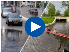
Stral in Ein...