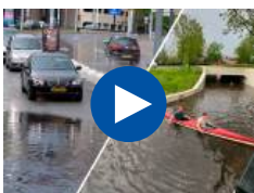
Stral in Ein...