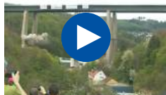
Duits brug ge...