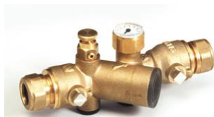
keerklep ( EA)