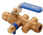
Afsluiter + combinatie

Brandslanghaspel aansluiten met een afsluiter en controleerbare keerklep (type EA) aan het begin van de toevoerleiding naar de haspel.