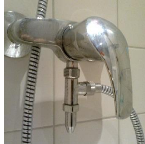
Wijze van plaatsing